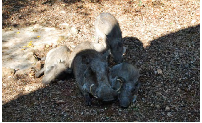
Bosbokkie is teruggekomen bij valavond. Alsook de kleine Nagapies.